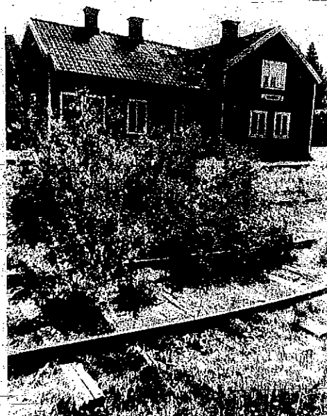
Vakerns centralpunkt är stationshuset. En gång i tiden var det full rulljans här, men nu har gräs och sly böjat täcka de tre parallellspåren.