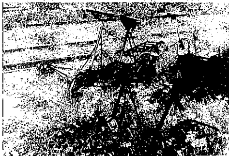
Trampdressiner är numera de enda fordonen som trafikerar Inlandshanan på finnmarken.

När kriget var över skulle aldrig Vakern mer bli sig likt. Sakta men säkert sjönk befolkningssiffrorna och det definitiva döds slaget blev nedläggningen av persontrafiken på Inlandshanan 1969. Den sista fas-