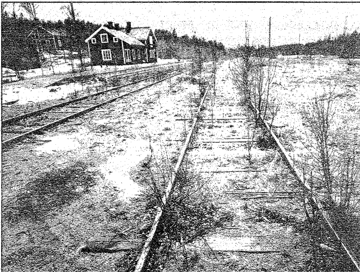
SJ lä ner järnvägen till Vakern för tio år sedan. Då bodde 200 människor där. Det fanns skola, flera affärer, post och ett sågverk. Vakernborna kämpade för sin järnväg, men SJ hade fattat sitt beslut, och människorna måste flytta.

— Men här har inte funnits något att tömma sedan i augusti, säger han.